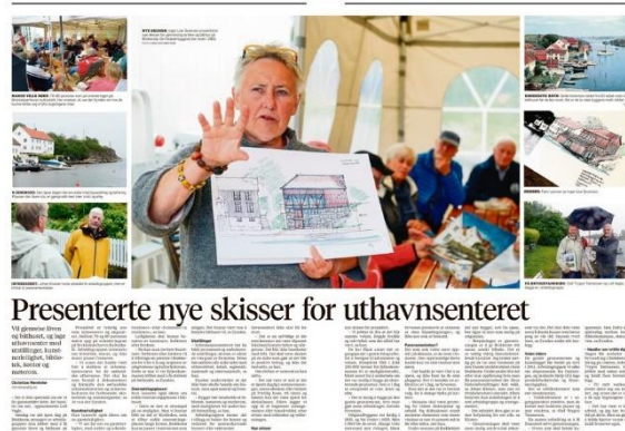
Presenterte nye skisser for uthavnsenteret

Som siste punkt i tildelingsbrevet fra fylket omfattet søknaden dekning av utgifter i forbindelse med arrangementet «Åpen dag». Søndag, den 20.6.2021 gjennomførte Brekkestø Vel og arbeidsgruppen Åpen dag i Brekkestø. Det ble orientert om historikk, status og planene fremover for prosjektet. Grunlaget for orienteringen i 2021 var basert på prosjektbeskrivelsen og tegninger pr. 20.6.2021 (1. trinn). Mellom 70 og 80 personer var møtt frem